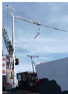
Schnellmontagekran CM 350. Industrie 4.0-fähiger 35-Meter-Kran mit Eco Mode-Funktion.