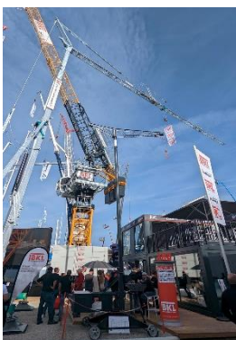
BKL auf der Bauma 2022. Neue Krane und der BKL Film erweisen sich als Besuchermagnete.