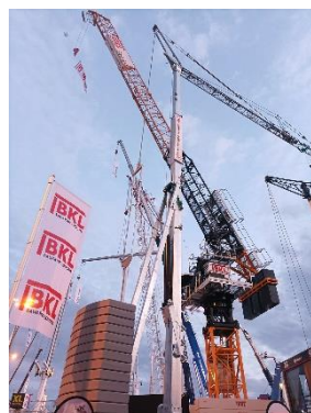
BKL auf der Bauma 2022. Die Kranspezialisten feiern ihr 15. Bauma-Jubiläum.